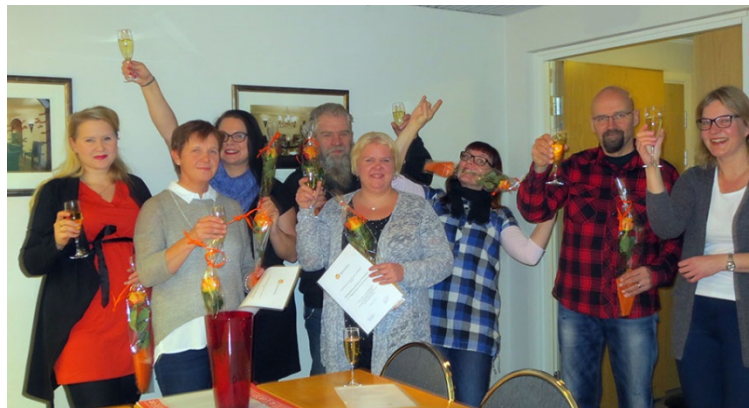
SuPerilaisten ammattiosastojen edustajia iloitsessa voitostaan.

Ammattiyhdistystoiminnan Vuoden Välkky -palkinnon saajaksi liittohallitus valitsi rekry-bussin, jonka on toteuttanut viisi Hämeenlinnan alueen SuPerin ammattiosasto. Hämeenlinnan alueen SuPerilaisten rekry-bussi kierrättää valmistuvia opiskelijoita työpaikoilla, joissa SuPerilainen lähihoitaja esittelee työtään. Välimatkoilla ammattiosaston edustaja kertoo ammattiyhdistystoiminnasta ja liiton kuulumisista. TJS:n hallinnon jäsenet pitivät tätä Välkky-ideologiaan hyvin sopivana kekseliäänä toimintatapana. Yhteistyönä tällainen tapahtuma on helpompi myös toteuttaa.