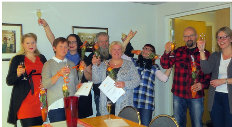
SuPerilaisten ammattiosastojen edustajia iloitsessa voitostaan.

Ammattiyhdistystoiminnan Vuoden Välkky -palkinnon saajaksi liittohallitus valitsi rekry-bussin, jonka on toteuttanut viisi Hämeenlinnan alueen SuPerin ammattiosasto. Hämeenlinnan alueen SuPerilaisten rekry-bussi kierrättää valmistuvia opiskelijoita työpaikoilla, joissa SuPerilainen lähihoitaja esittelee työtään. Välimatkoilla ammattiosaston edustaja kertoo ammattiyhdistystoiminnasta ja liiton kuulumisista. TJS:n hallinnon jäsenet pitivät tätä Välkky-ideologiaan hyvin sopivana kekseliäänä toimintatapana. Yhteistyönä tällainen tapahtuma on helpompi myös toteuttaa.